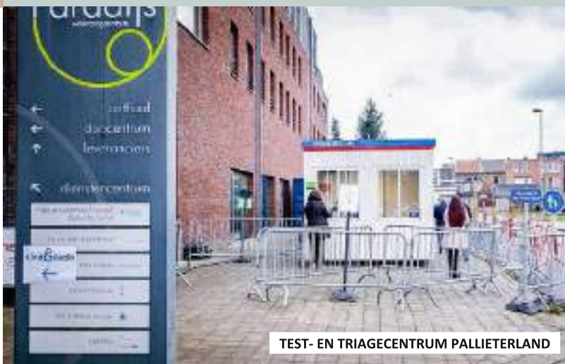
TEST- EN TRIAGECENTRUM PALLIETERLAND

Doordat een deel taken wegvielen vanwege de coronamaatregelen, sprong het personeel tijdens de vrijgekomen tijd ook in op andere diensten om bijkomende ondersteuning te bieden waar dat dringend nodig was in volle crisis (in woonzorgcentra, triagecentrum en huisartsenwachtpost). Er werd zoveel mogelijk overgeschakeld op thuiswerk voor de administratieve taken.