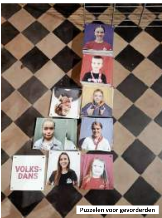
Puzzelen voor gevorderden

Dit indrukwekkende kunstwerk van meer dan 800 kleurrijke foto's werd een week lang bewonderd door elke voorbijganger. Lier haalde daarmee het RTV-nieuws en ook VTM Nieuws.