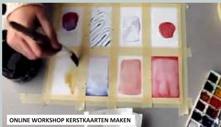
ONLINE WORKSHOP KERSTKAARTEN MAKEN

De verdeling van de kaarten verliep via de collega's van straathoekwerk, die nauwe contacten hebben met de doelgroep waarvoor ze bestemd waren. Vanuit vzw De Moeve werd ook een online workshop georganiseerd om zélf creatieve wenskaarten te maken.