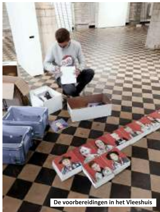
De voorbereidingen in het Vleeshuis