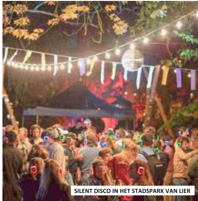
SILENT DISCO IN HET STADSPARK VAN LIER

Het tweede luik bestond uit het kwalitatieve onderzoek waarbij er in dialoog gegaan werd met een focusgroep, bestaande uit leden van de verschillende jeugdbewegingen en jeugdwerkingen.